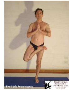
Eka pada pranamasana