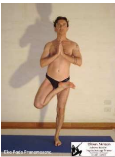
Eka pada pranamasana